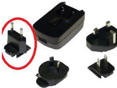
USB Power Adapter Set